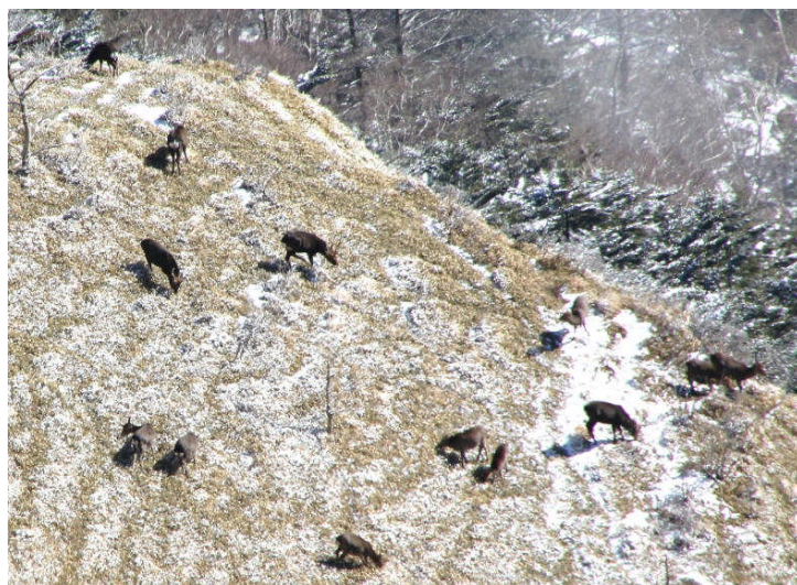
群れてササを食べる三嶺のシカたち 管理捕獲によって減ったのだが…

第一部 では、食害によって激しい被害を受けた三嶺の自然が、捕獲の進展（シカの減少）やマット張り活動によって再生している様子を報告します。併せて、依然として深刻な樹林内の環境悪化の様子を、写真を交えて解説します。